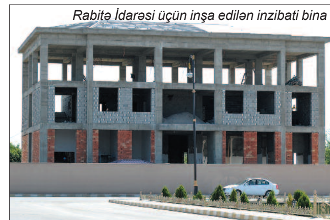
Rabitə İdarəsi üçün inşa edilən inzibati bina

Cari ilin birinci yarısında 13 yaşayış məntəqəsini əhatə edən Hacıvar-Vayxır-Sirab avtomobil yolu yüksək keyfiyyətlə yenidən qurularaq istifadəyə verilib. Babək qəsəbəsində rayon Mərkəzi Xəstəxanası və uşaq bağçası üçün yeni binalar tikilib. Həmin obyektlər müasir avadanlıqlarla təmin olunub, onların yerləşdikləri ərazilər abadlaşdırılıb. Rayon Tarix-Diyarşünaslıq Muzeyinin binası yenidən qurularaq müasir görkəmə gətirilib.