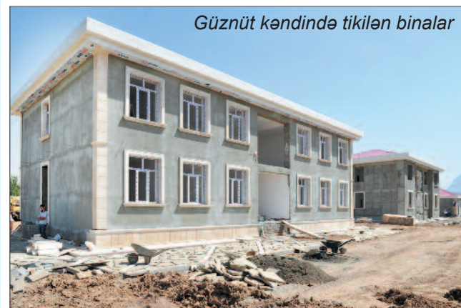
Güznüt kəndində tikilən binalar